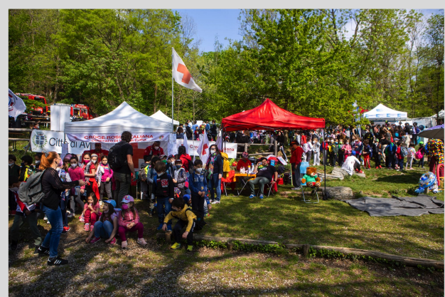
FIGURE PROFESSIONALI COINVOLTE: Medici, infermieri ed operatori tecnici sanitari dell'ASLTO3, personale di servizio degli Enti Pubblici e volontari delle Associazioni di volontariato locale partecipanti.

MATERIALE DIDATTICO FORNITO: Materiale informativo per ogni classe ed attestato di partecipazione per ogni alunno; (si precisa che trasporti e accoglienze alberghiere, sia in termini economici ed organizzativi, sono a totale carico della scuola partecipante).